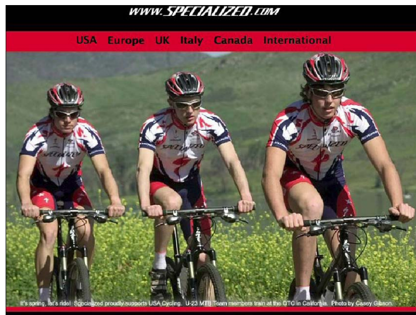
使用相同的统一数据创建针对不同地区或不同客户群的专卖店

针对多个具有地区特色的网上商店，而所有这些商店都共享全球目录数据。该网上商店系统还通过多语言多货币支持为您提供全球创收机会。