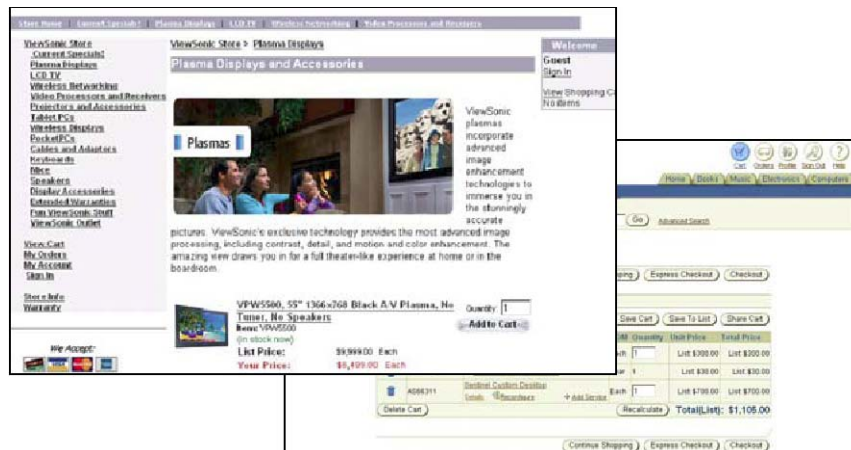
健壮的订单捕获和后端集成功能可降低从接收订单到履行的销售成本

Oracle 网上商店系统将整个销售流程置于网上，从而提供一个永远开放的互联网销售渠道，客户可以随时进行购买。它可以大幅削减销售成本，同时使客户可以更方便地与你开展业务。网上商店系统动态生成的目录内容和产品搜索功能可以帮助客户轻松查找所需的产品和服务。与基本的“网上商店”不同，Oracle 网上商店系统先进的交互式销售功能使客户在访问过程中可以寻求现场销售帮助，但这仍比离线交易的销售成本低很多。结账时可以定义灵活的支付选项，并启用自动支付处理功能，从而缩短收款时间，减少工作量。