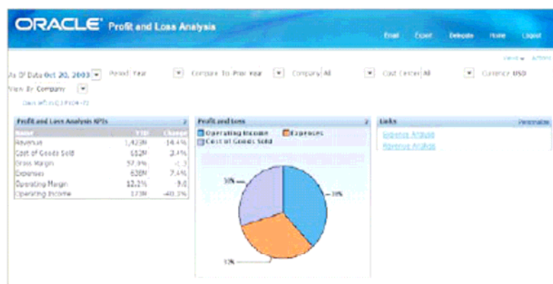
图 2.损益分析信息显示板为管理人员和分析人员提供了其机构的财务信息视图