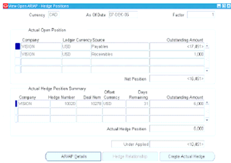
图 2. 外币套期保值头寸