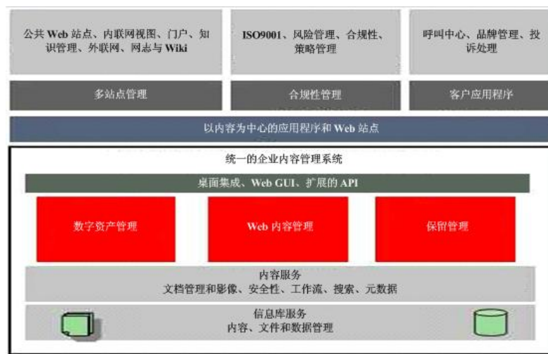
图 2. Oracle 全面内容管理提供统一的 ECM 平台。