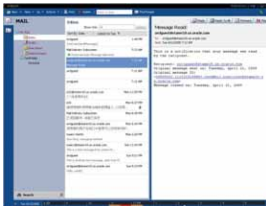
Рисунок 2. Web-интерфейс Oracle Web Access

Oracle Mail предоставляет унифицированную инфраструктуру для обмена сообщениями с хранением всех типов сообщений (включая электронную почту, голосовую почту и факсы) в едином репозитории в СУБД Oracle 10g. СУБД Oracle 10g, являясь лидером в области хранения и обработки информации, обеспечивает Oracle Mail беспрецедентными возможностями по обеспечению доступности и целостности информации, скорости восстановления данных, отказоустойчивости и масштабируемости. Oracle Mail позволяет вести всю почтовую информацию (сообщения, списки рассылки, почтовые правила и т.д.) в рамках одного сервера, что устраняет необходимость администрирования и синхронизации множества почтовых серверов Oracle Mail использует все преимущества технологий Oracle Real Application Clusters, многопоточковой, параллельной обработки данных, высокой доступности и высокой производительности СУБД Oracle 10g для организации бесперебойной работы тысяч пользователей при быстром времени отклика системы.