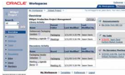
Рисунок 5. Web-интерфейс Oracle Workspaces 10g

Oracle Workspaces SDK позволяет Заказчикам и партнерам использовать сервисы Oracle Workspaces для разработки собственных приложений. При этом контент и функциональность рабочих пространств будут доступны и из клиентов Oracle Workspaces, что обеспечивает дополнительные удобства и гибкость выбора средств коллективной работы в рамках рабочих пространств в зависимости от обстоятельств и местонахождения участников рабочих групп.