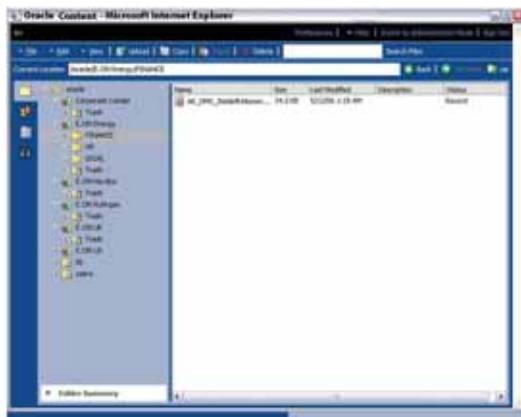
Рисунок 1. Web-интерфейс Oracle Content DB

пуска на выполнение по наступлению определенных событий (например, изъятие для использования, запрос на чтение, удаление перемещение, загрузка документов).