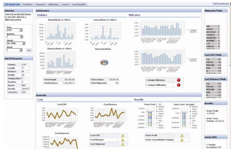
図 1: 重要な KPI を含む構成が可能なウォッチ・リスト

さらに、ユーザー定義の KPI だけでなく、アドホックの問合せとレポート作成により、必要なときに情報を取得できます。