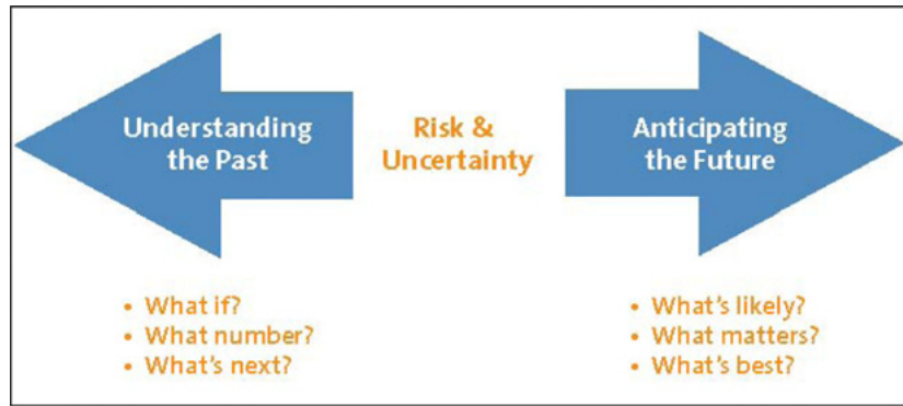
그림 1: 과거를 파악하는 것은 미래를 모델링하는 데 많은 도움을 줄 수 있습니다.

이러한 질문에 답하고 정확한 의사 결정을 계획하기 위해서는 향후 결과의 모든 가능한 측면과 실제로 발생할 각 결과의 가능성을 우선 파악해야만 합니다.