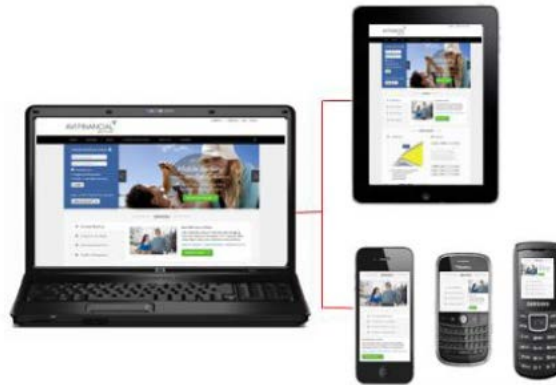
図 1 : Oracle WebCenter Sites のモバイル・オプションでは、モバイル・チャンネルへの Web サイトのシームレスで一元化された管理および展開を実現します。

モバイル Web は個人にとって、組織とやり取りしたり、製品およびサービスの情報を確認したりするための主要な接点となってきています。このため、組織はモバイル・チャンネルを利用して、その他のチャンネルにおけるやり取りと整合のとれた方法で利用者にリーチする必要があります。