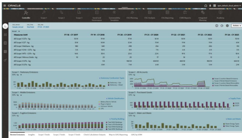
Dashboard ESG con metriche sugli aspetti sociali