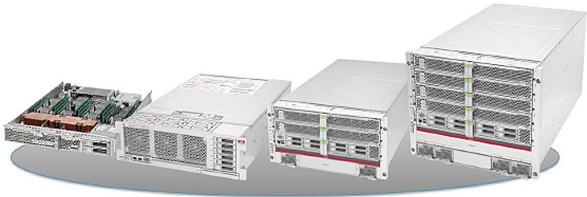
図1 SPARC T5サーバー

単に信頼性の高いコンポーネントを装備しているよりも、RAS機能が備わっていることの方がはるかに大きな意味があります。RAS機能には高度な統合管理機能と監視機能を兼ね備えた、ハードウェア機能とソフトウェア機能の組合せが含まれています。これらの機能を1つにまとめることで、SPARC T5サーバーでは、ミッション・クリティカルなアップタイムと信頼性を実現することが可能になっています。