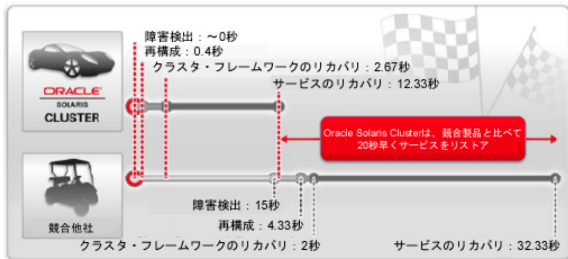
図3 Oracle Solaris Clusterのリカバリ時間

Oracle Solaris Clusterを使用すると、ITサービスを再開するための時間が大幅に短縮されます。Oracle Solaris Clusterでは、SPARC T5サーバーにおけるこの処理を高速化するとともに、次の機能を提供します。