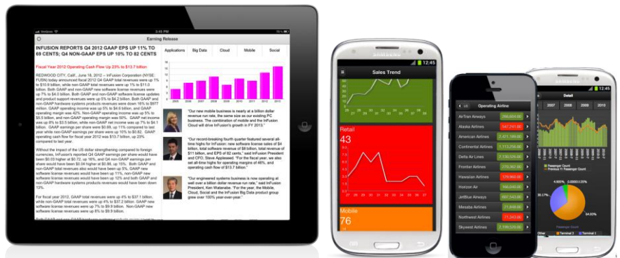
图 1 — 移动设备上的 BI Mobile App Designer 应用