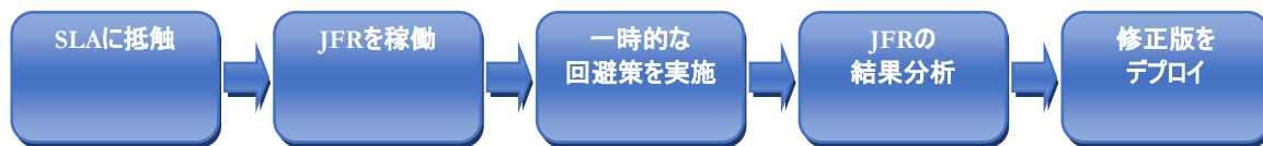
図3. Java Flight Recorderを本番環境で利用した場合のワークフロー

JFRを設定し、データをディスクに書き出さないように設定することができます。このモードでは、グローバル・バッファは循環バッファとなり、古いデータはバッファが一杯になった時点で削除されます。この非常に低いオーバーヘッドのモードであっても、問題の根本原因を分析するために必要なすべての重要なデータを収集します。ほとんどの最新のデータは常にグローバル・バッファで利用可能なので、運用システムや監視システムが問題を検知した場合には、必要に応じてディスクに書き出すことができます。